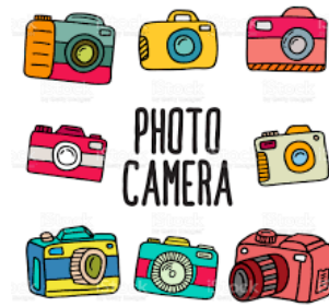
FOTO- EN FILMOPNAMES

Soms worden er bij ons op schoolfoto's gemaakt (feesten, schoolkamp enz.).