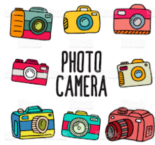
FOTO- EN FILMOPNAMES

Soms worden er bij ons op schoolfoto's gemaakt (feesten, schoolkamp enz.). Tevens wordt er af en toe gefilmd, bijvoorbeeld voor studies van leerkrachten met betrekking tot leerkrachtgedrag. Vorige week heeft u, via uw kind, een formulier van ons ontvangen waarop we u vragen schriftelijk aan te geven waar u wel of geen bezwaar tegen heeft, zodat wij rekening met uw wensen kunnen houden.